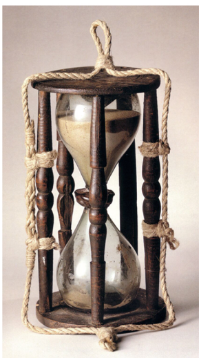
Musée de Fécamp

Horloge d'une demi-heure. Pour un meilleur écoulement, le sablier est suspendu.