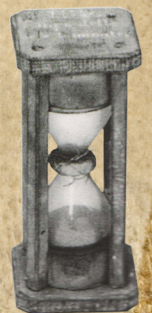
Ampoulette de 30 s

Pour trouver la vitesse, on s'intéresse à la distance parcourue par le navire pendant un court laps de temps, d'ordinaire 30 secondes, la durée d'un sablier appelé ampoulette.