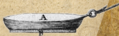
Un loch "petit navire"

Le mot loch vient de l'anglais et signifie « bûche ». Le loch est « un petit morceau de bois taillé en forme de barque, chargé d'un plomb » et est parfois appelé « petit navire ». Le loch est lesté pour qu'il se place verticalement et pénètre dans l'eau : il peut alors être considéré comme un point fixe de la mer dont on s'éloigne à une certaine vitesse... justement, la même que celle du navire lui-même.